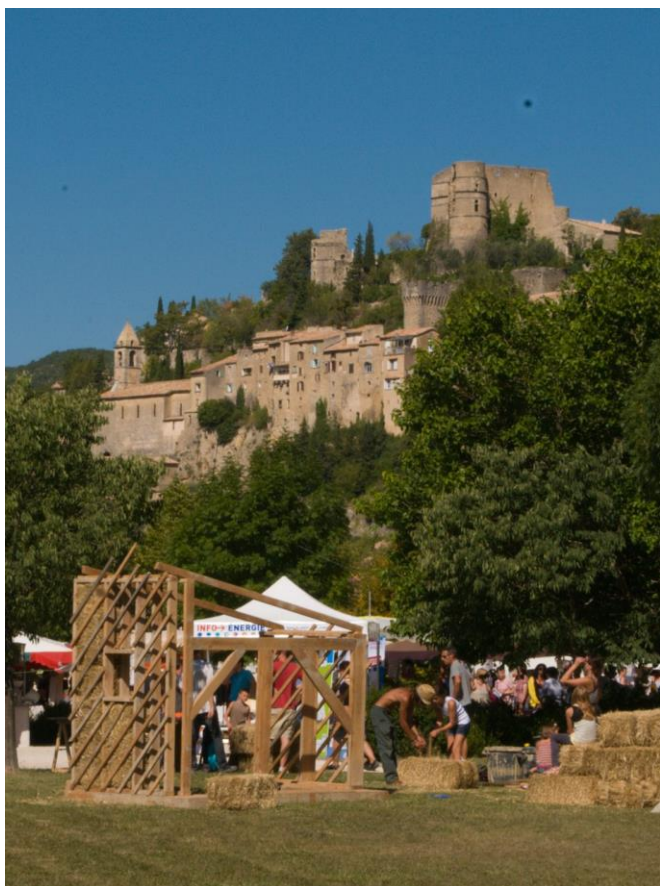
Au cœur du parc