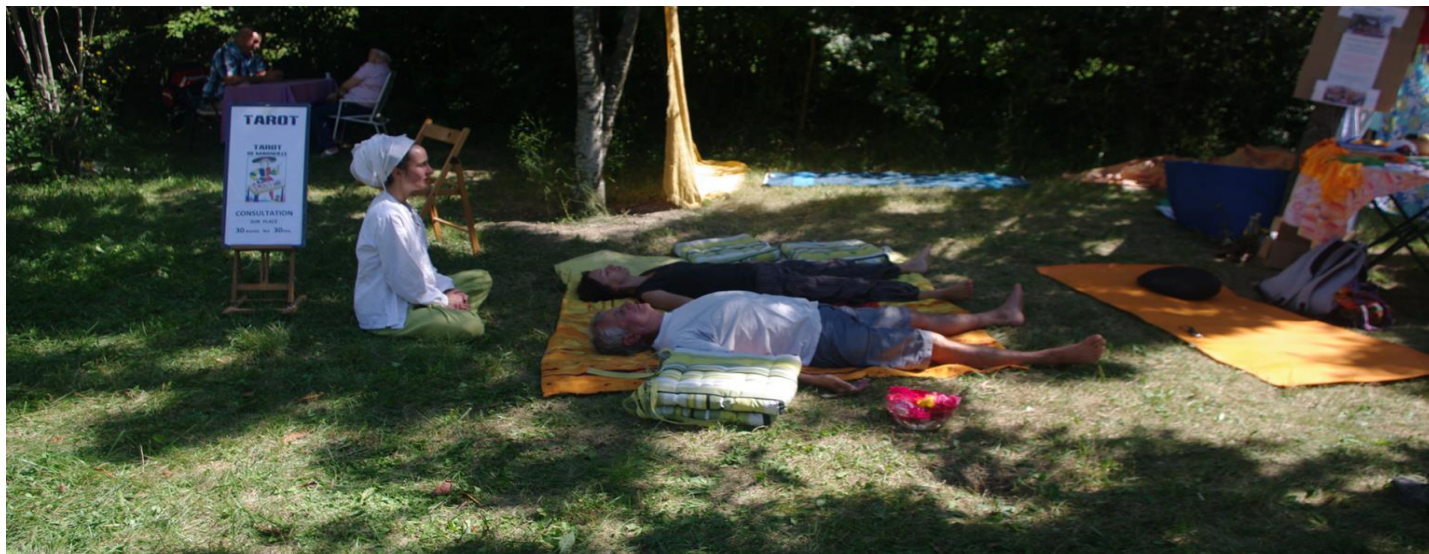
Relaxation et méditation.