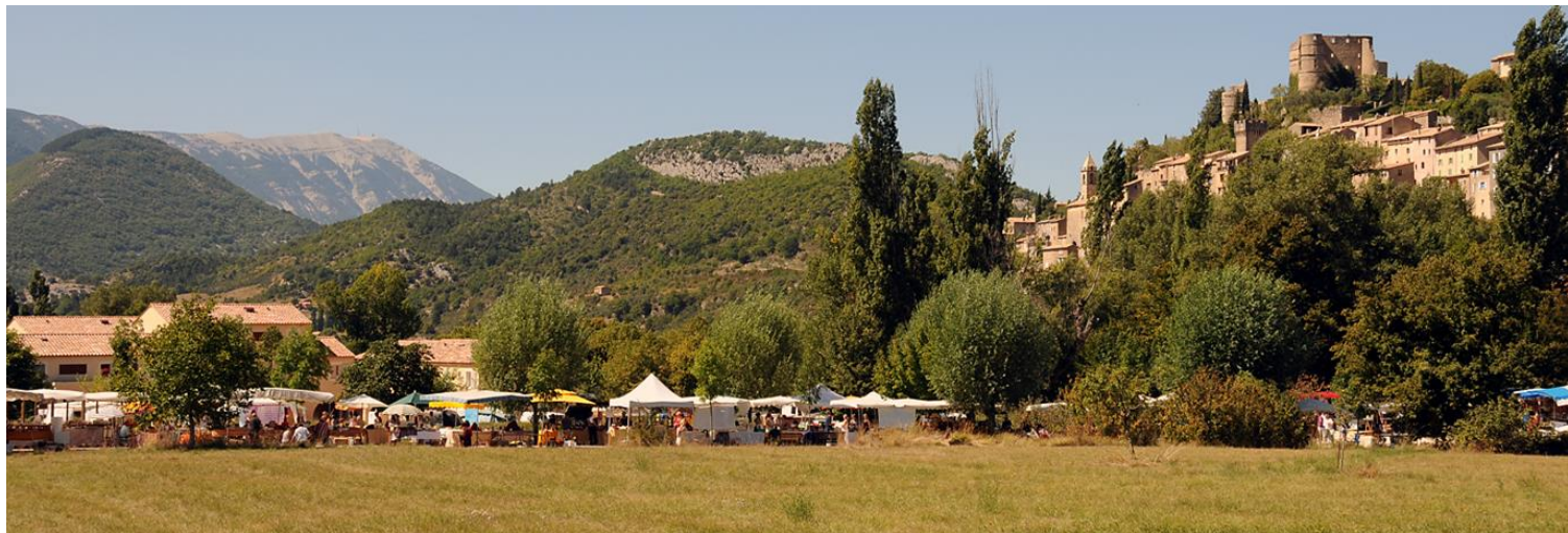
Montbrun les Bains, au pied du Ventoux

La journée Bien Etre au Naturel se déroule dans un cadre propice à la détente. Au pied du village de Montbrun les Bains, classé parmi les plus beaux villages de France, le parc accueille exposants et visiteurs au calme.