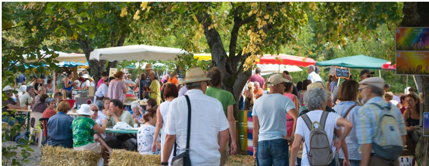
Un espace restauration ombragé et convivial

L'espace restauration le long des berges de l'Anary regroupe plusieurs stands de restauration : à base de plantes, bio, végétan, produits locaux et différents stands de boissons, glaces artisanales.