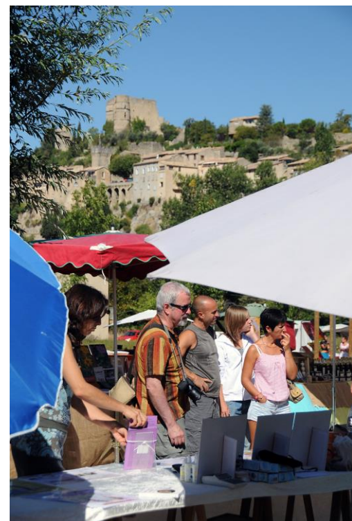
Des produits naturels, plantes, cosmétiques...

Office de Tourisme des Baronnies en Drôme Provençale, Bureau de Montbrun-les-Bains : 0475288249