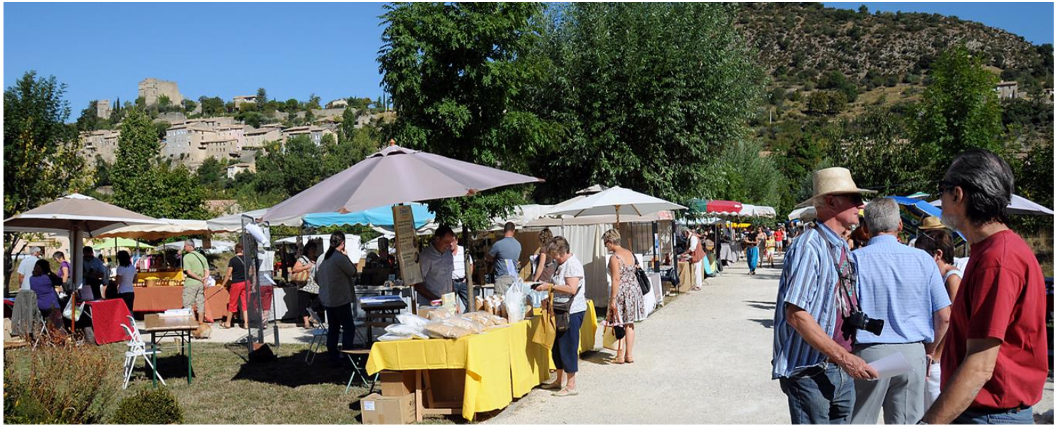
Le marché où il fait bon flâner