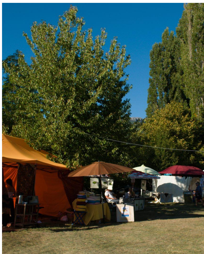
Un lieu calme et reposant

Office de Tourisme des Baronnies en Drôme Provençale, Bureau de Montbrun-les-Bains : 0475288249