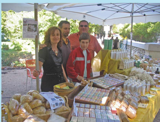
La savonnerie en provence