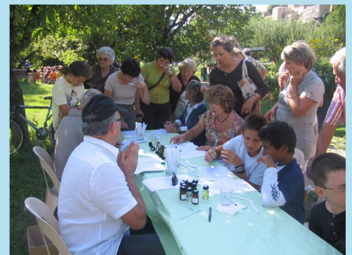
Le concours des senteurs