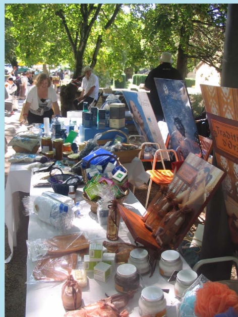
Stand du marché